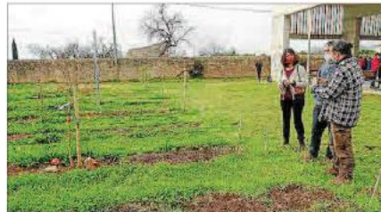
El huerto del IES Binissalem servirá para que los alumnos experimenten.

Los más jóvenes se instruyen de manera divertida en identificar las variedades locales de frutas, verduras y hortalizas